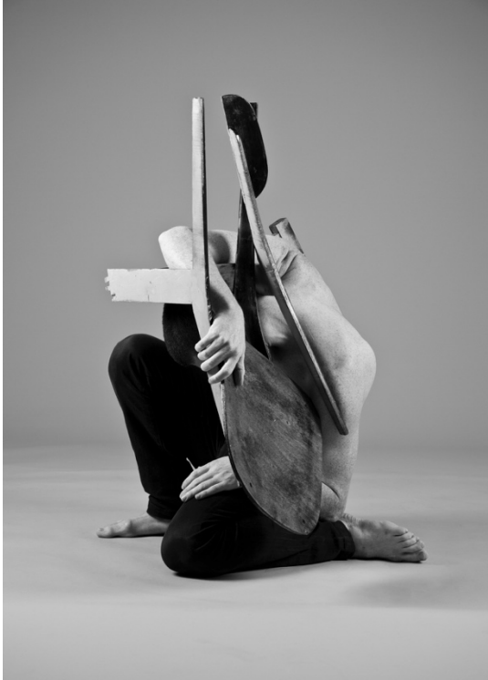
Musical Chais, Ofir No.1 (2012, Israel)