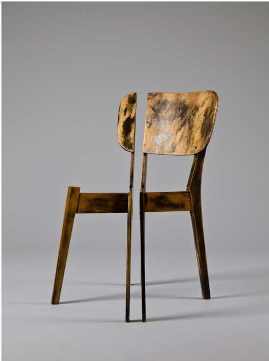
Dynamic Measurements No.2 (2012, Israel)