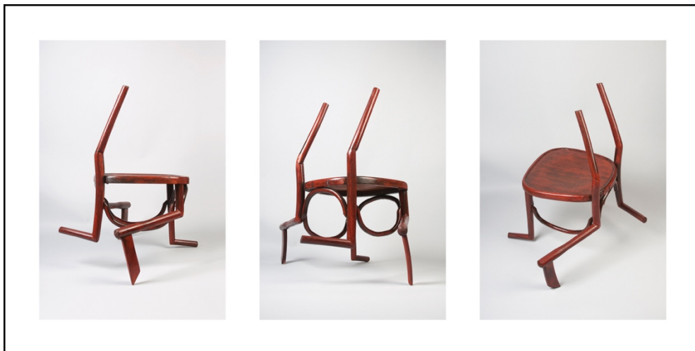
Simultaneously Chair No.9 (2012, Israel)