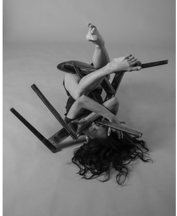
Musical Chairs, Yuko No.1 (2016, Israel)